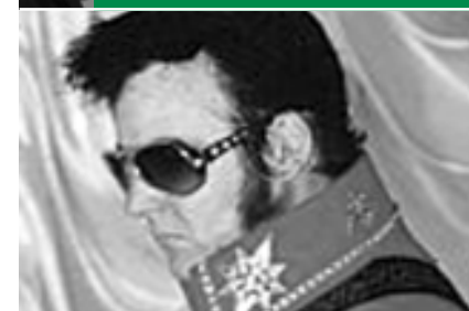
12 Elvis lebt weiter