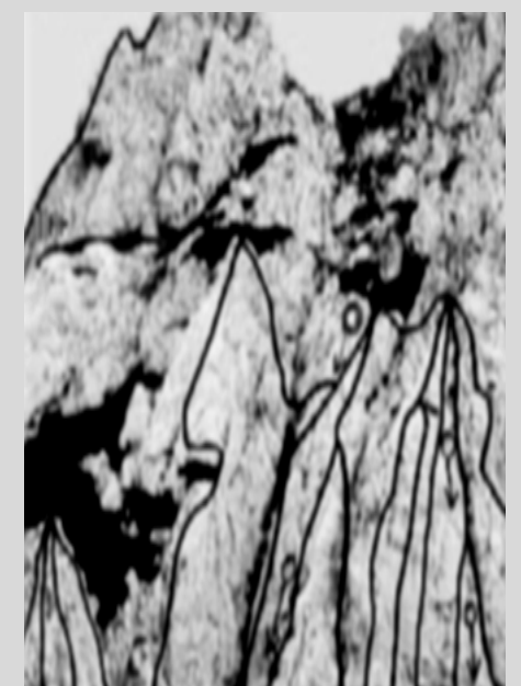
Die verschiedenen Zugangswege zum Gipfel