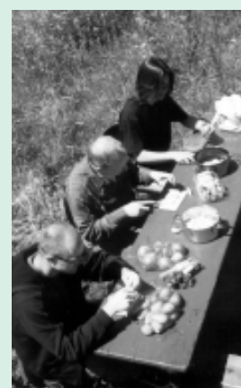
Verseuchung des veganen Essens durch Verunreinigung. Fleischbeilage entdeckt: Käfer und Insekten in der Pampe beim Ostseekämp. Noch ahnen die beteiligten Küchenhelfer nichts.